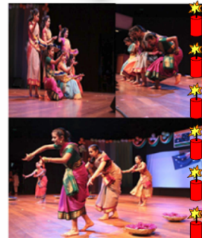
Indian Multicultural Dances